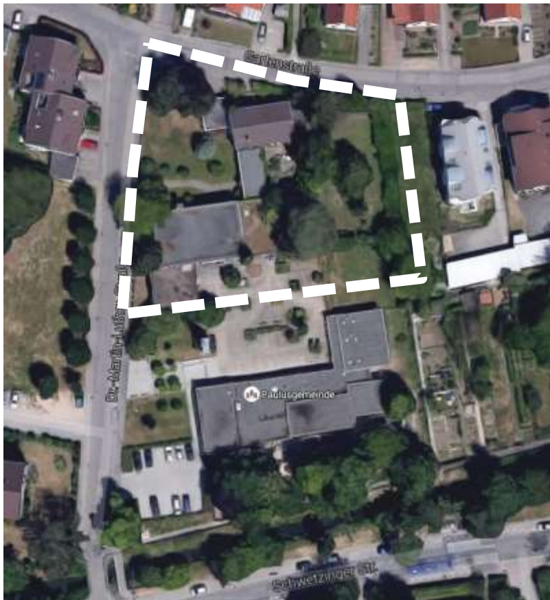
Planbereich ca. 0,35 ha „Gartenstraße / Dr.-Martin-Luther-Straße“

Für die Abgrenzung des Planbereichs (ca. 0,35 ha) ist der Geltungsbereich des zeichnerischen Teils zum Bebauungsplan „Gartenstraße / Dr.-Martin-Luther-Straße“ (Anlage 1) maßgeblich.